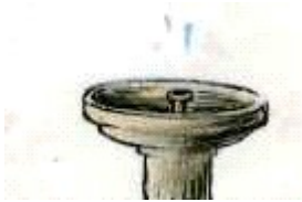
La fuente no echa agua.