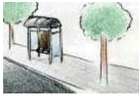
Aquí cerca tienes una parada de autobús.