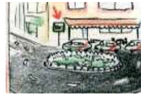
La parada de taxis está en la plaza.