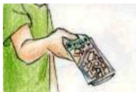
¿Tienes el callejero de Sevilla?