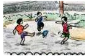
Los niños juegan en la plazoleta.