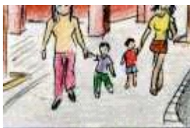
Las mamás pasean a sus hijos pequeños.