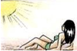
Tomar el sol _____