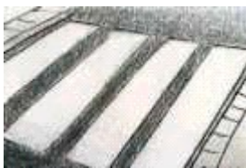
Paso de peatones _____