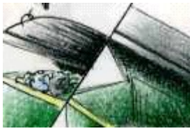
Los contenedores están llenos / vacíos.