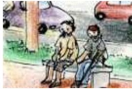
Los ancianos toman el sol en los bancos.