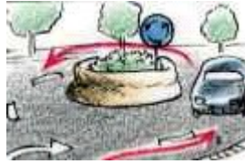
Dar la vuelta / una vuelta _____