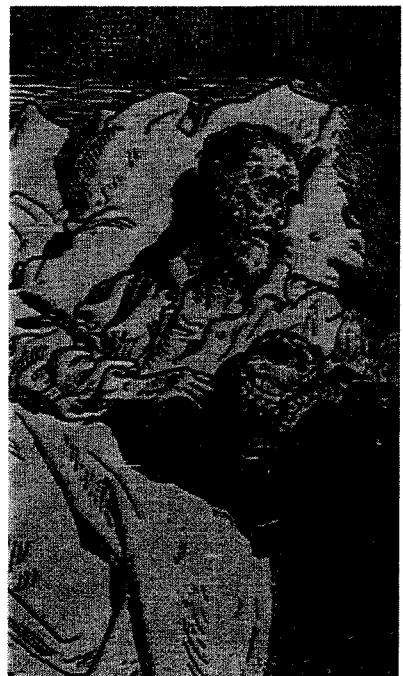
Don Quijote recupera la cordura para morir (grabado de Gustavo Doré).

18 mohíno : enfadado o de mal humor y con gesto o actitud de estarlo; por ejemplo, con la cabeza baja.