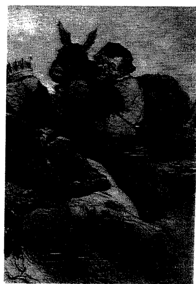
Sancho Panza (litografía de 1845).