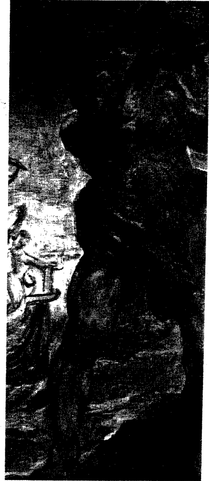
Polifemo, boceto de Pedro Pablo Rubens.